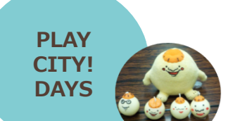
▲謎解きまち歩きとマグニオンをPRする企画を実施