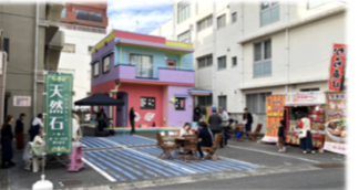
▲店舗＋駐車場スペースの利活用