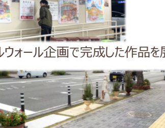
▲SNS発信のほか、開催前後に地元新聞にも掲載