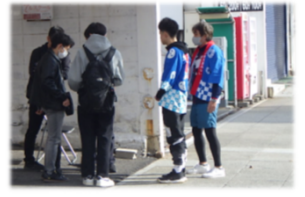
▲オーガニックフェスタの来場者やクルーズ船から降りてきた外国人観光客、山形屋駐車場利用者などが多く通行